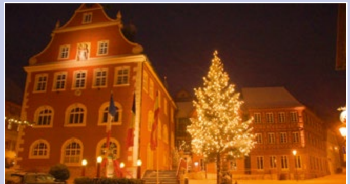
Das barocke Rathaus in Ettenheim.

Ausgebildete Stadtführer führen die Gäste regelmäßig durch die heimeligen Gässchen. Aber nicht nur mit einer geplanten Führung, sondern auch auf eigene Faust können Sie viel Wissenswertes erfahren und die schönsten Sehenswürdigkeiten der barocken Altstadt entdecken. Ein Wegweiser mit 25 Stationen ist kostenlos in der Tourist Information erhältlich.