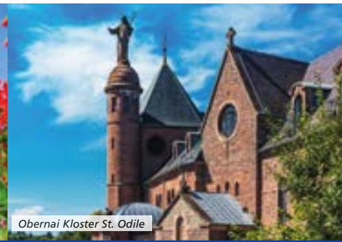
Obernai Kloster St. Odile