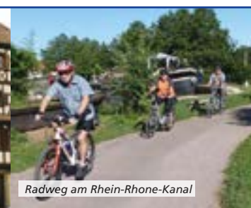
Radweg am Rhein-Rhone-Kanal