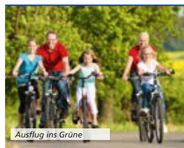
Ausflug ins Grüne

Place du Beffroi F-67210 Obernai T +33 (0) 388 956413 | F +33 (0) 388 499084 E info@tourisme-obernai.fr www.obernai.fr