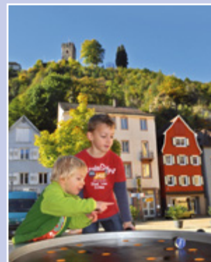
Spiel und Spaß sind auf dem Hornberger-Schießen-Weg garantiert.

In der Höhle des Pulverturms auf dem Schlossberg, der letzten Station des Hornberger-Schießen-Weges, zeigt Ihnen zudem eine Multi-Media-Präsentation mit einem Augenzwinkern und viel Selbstironie, wie sich das berühmte Missgeschick zugetragen haben könnte. Anhand von Szenen aus der Aufführung des Hornberger Schießens, welches all sommerlich in der romantischen Freilichtbühne Hornberg mehrmals von rund 80 Akteuren farbenfroh aufgeführt wird und einem erzählenden Landsknecht, erfahren Sie so auf unterhaltsame Weise dieses Stück deutsche Sprachkultur.