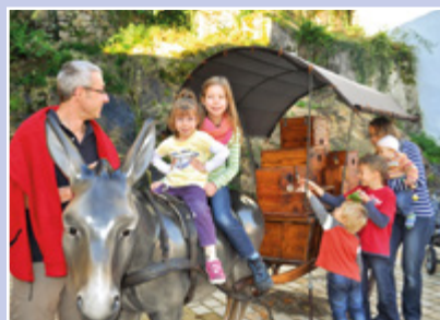
Interessantes und Schmunzelhaftes erfahren die Besucher an 14 Stationen auf dem Hornberger-Schießen-Weg.

Doch was steckt genau dahinter? Das erleben Sie auf dem Hornberger-Schießen-Weg von der Stadtmitte bei der evangelischen Kirche bis hoch zum Hornberger Schlossberg auf unterhaltsame Weise, wie es sich zugetragen haben könnte. Unterwegs machen Spielstationen auch für Kinder den Weg zu etwas Besonderem, zudem erwarten Sie Picknick-Möglichkeiten. Oben angekommen genießen Sie den Blick ins Gutachtal und auf die Schwarzwaldbahn. Hornberg mit seinem Viadukt liegt Ihnen als einmalige Eisenbahnlandschaft zu Füßen! An 14 Stationen erfahren Sie Interessantes und Schmunzelhaftes über das Ereignis im Jahre 1564, welches Hornberg weit über die Grenzen hinweg bekannt gemacht hat.